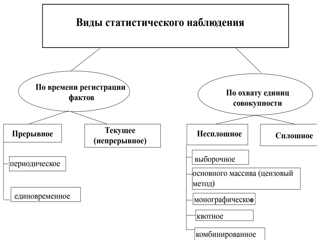
Рисунок 1 – Виды статистического наблюдения

Сплошным называется такое наблюдение, при котором обследованию подвергаются все без исключения единицы изучаемой совокупности (объекта наблюдения).