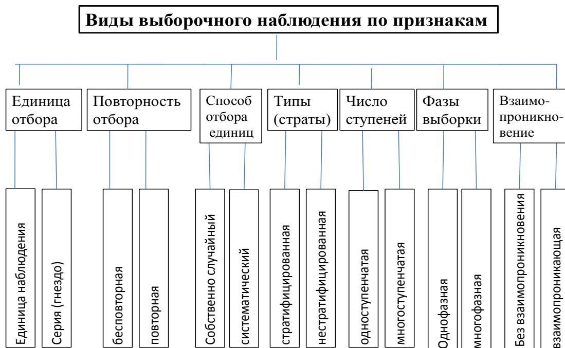
Рисунок – Виды выборочного наблюдения в социально-экономической статистике

Механическая выборка представляет собой отбор единиц через равные промежутки (по алфавиту, через временные промежутки, по пространственному способу и т.д.). При проведении механической выборки применяют только бесповторный отбор.