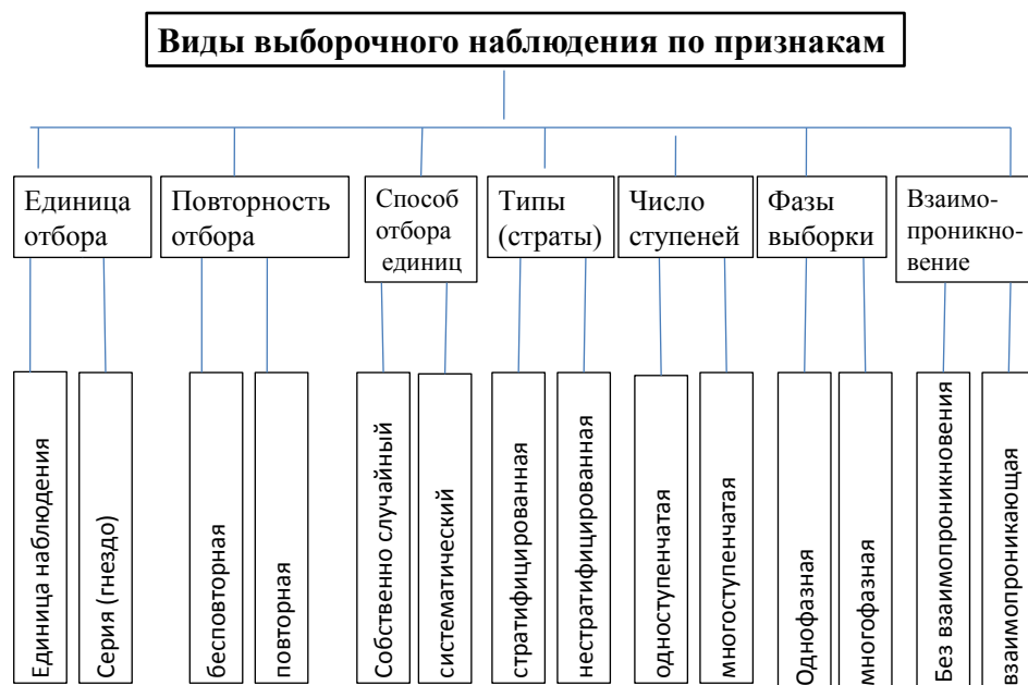
Рис. – Виды выборочного наблюдения в социально-экономической статистике

Различные виды выборочного наблюдения классифицируются по семи признакам, как показано в схеме 1.