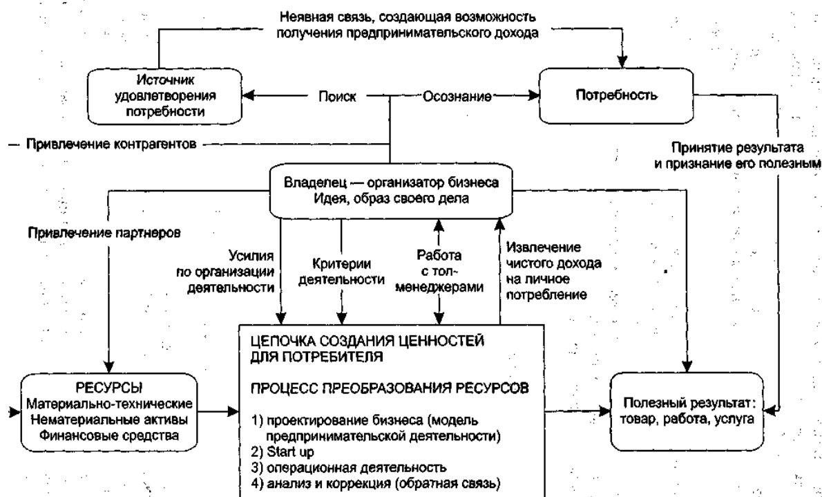
Рис. 6.1. Место владельца в организации бизнеса

Агент должен предоставлять принципалу всю информацию об операциях с предоставленной собственностью, а также предоставлять процент дохода от собственности (или полную сумму дохода). Так, например, менеджер будет являться агентом по отношению к собственнику, который заинтересован в получении прибыли от своего бизнеса, и по отношению к инвестору, который вкладывает свои ресурсы в бизнес и заинтересован в доходе от собственных ресурсов.