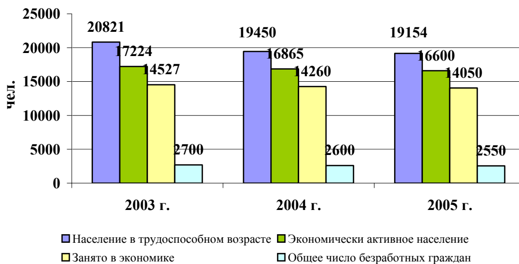
Рисунок 1.1 – Динамика экономической активности, занятости и безработицы по городу Медногорску в среднегодовом исчислении (чел.)