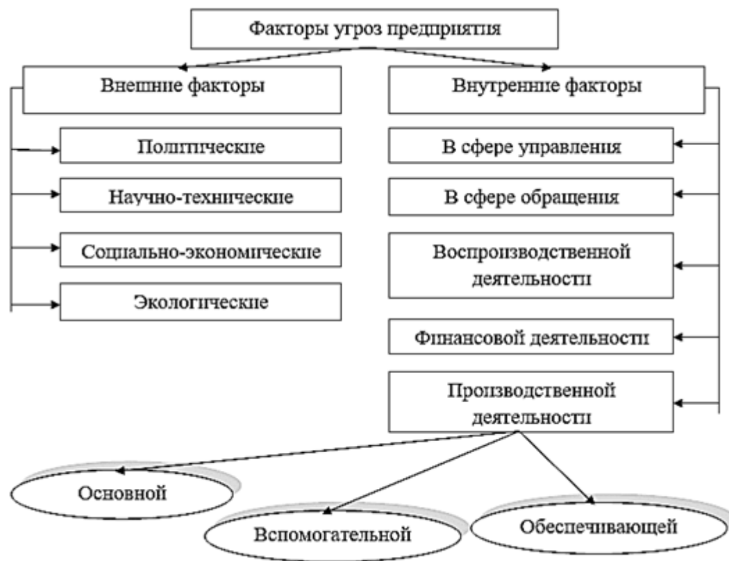
Рис. 1 Классификация факторов угроз безопасности предприятия

могут быть внутренними и внешними, экономическими и внеэкономическими, объективными и субъективными. Проведенный анализ различных литературных источников позволяет следующим образом классифицировать внешние и внутренние факторы угроз (рисунок 1).