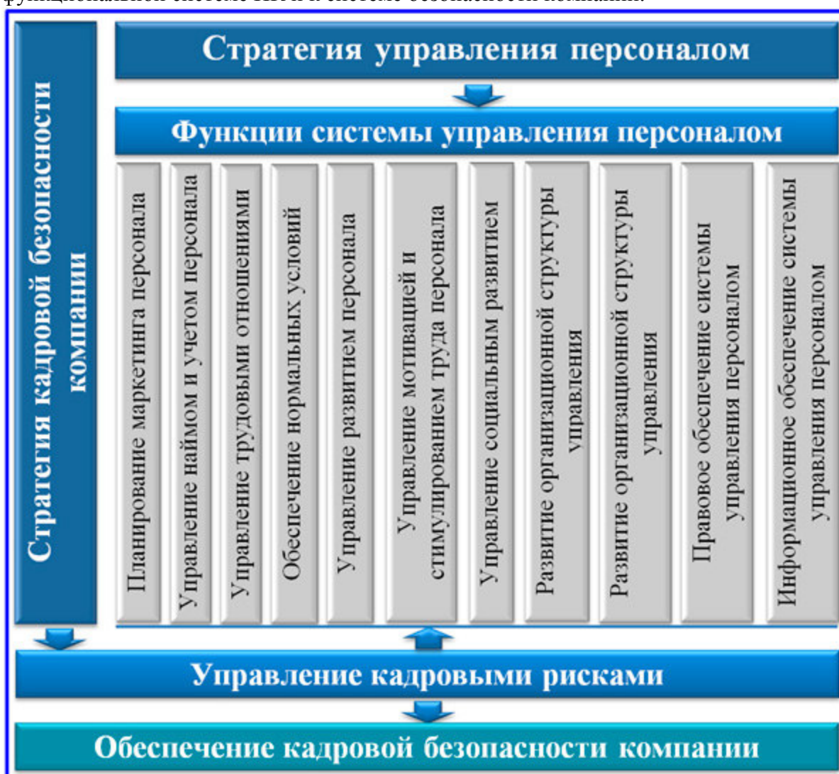
Схема взаимосвязей систем управления кадровыми рисками и безопасности

С одной стороны, в управлении рисками персонала прослеживается типовая методика работы с вероятностью возникновения неблагоприятных событий в бизнесе. Управление рисками данной категории включает процедуры выявления, оценки и контроля факторов риска с позиции внешних и внутренних источников возникновения. С другой стороны, регулирование потенциальных кадровых угроз максимально близко подходит к стратегии управления персоналом и стратегической концепции безопасности деятельности. Это означает двойственную принадлежность процесса управления риска персонала к функциональной системе HR и к системе безопасности компании.