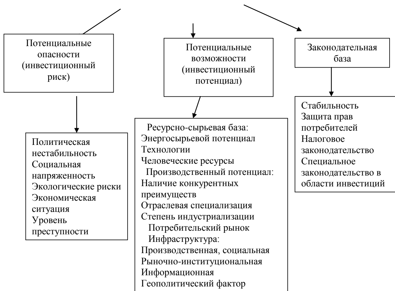
Рис. 5 - Классификация факторов инвестиционного климата страны

В распоряжении государства имеется разнообразный набор средств регулирования платежного баланса, направленных либо на стимулирование, либо на ограничение внешнеэкономических операций в зависимости от валютно-экономического положения и состояния международных расчетов страны.