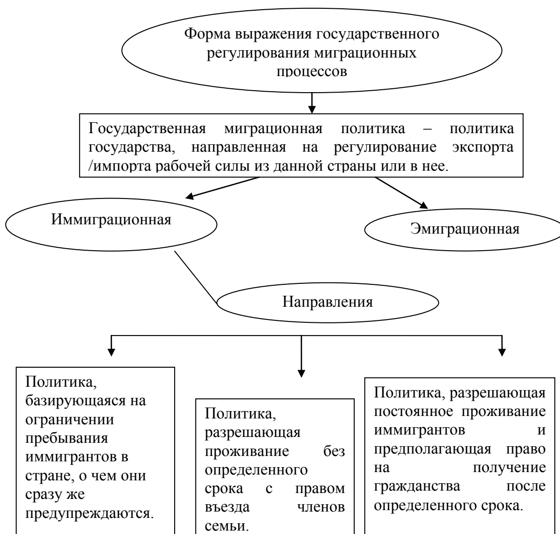
Рисунок 1 - Государственное регулирование миграционных процессов

2. Показатели, характеризующие научные ресурсы отдельных стран и группы стран. Результативность сферы НИОКР.