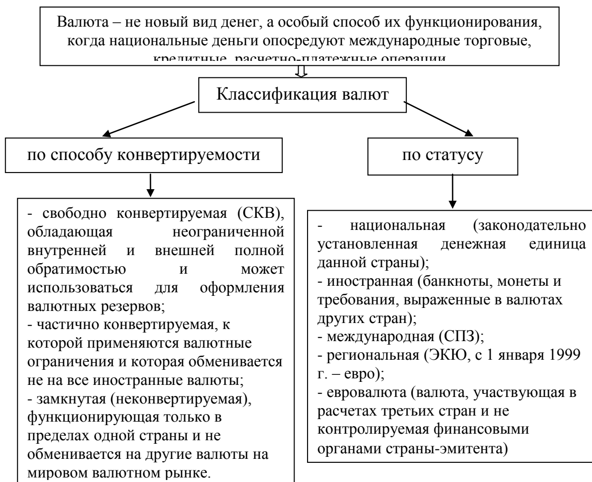
Рисунок 7. – Классификация валюты

Валютной выручкой называют поступления иностранной валюты в качестве платы за продукты или услуги, экспортированные за границу или реализованные на внутреннем рынке за иностранную валюту.