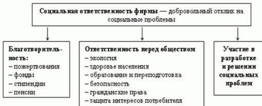
Рисунок 2 - Виды социальной ответственности фирмы (слайд 7)

улучшению репутации и имиджа. Следует также отметить, что ответственность бизнеса не ограничивается только различными добровольными вкладами в развитие общества, она также предполагает соблюдение определенных правил и норм общения. На мой взгляд, это и есть ничто иное, как неизбежный естественный процесс при развитии общества и увеличении количества предприятий - ведь без должного этического отношения друг к другу и к обществу сосуществование и развитие просто невозможно. Такая ответственность это не закон и правило, а, скорее всего, этический цивилизованный принцип, который неизбежен и, с другой стороны, очень важен для современного общества. Виды социальной ответственности фирмы представлены на рисунке 2.