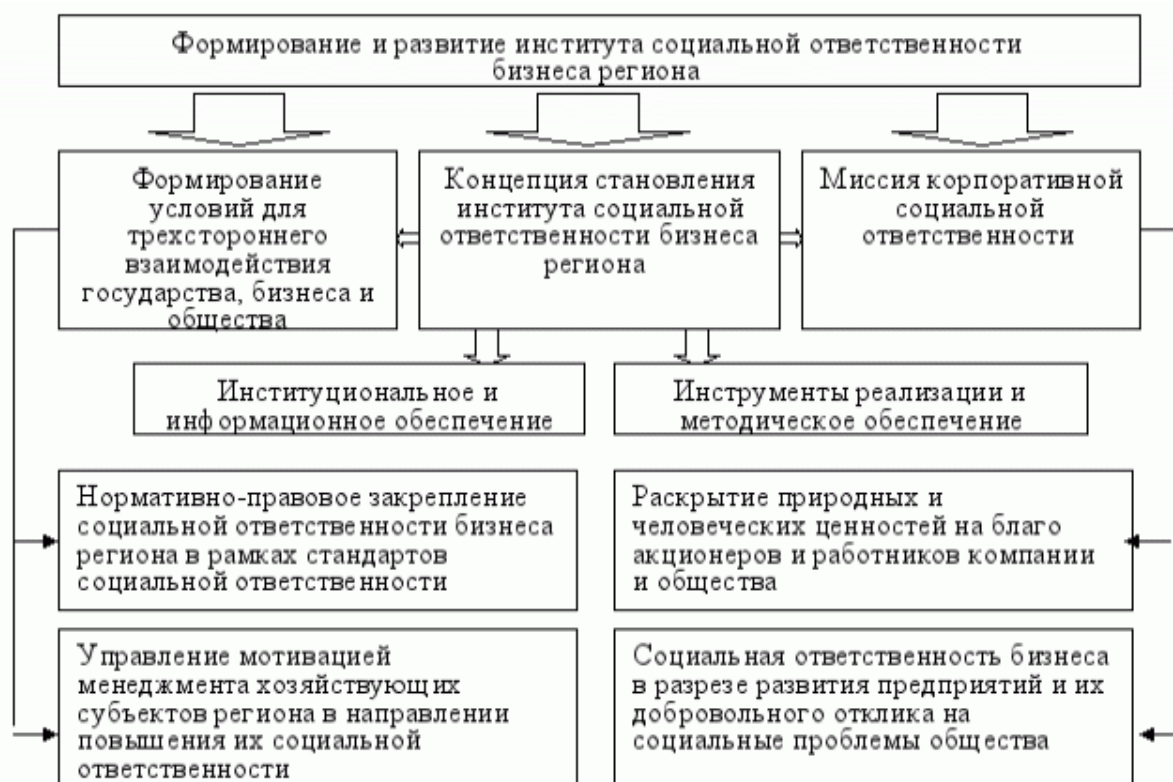
Рисунок 1 - Социальная ответственность бизнеса региона

Тема социальной ответственности бизнеса активно обсуждается за рубежом. Но, поскольку данный вид деятельности реализуют, в основном, крупные корпорации, она именуется на западе как корпоративная социальная ответственность (КСО). При этом КСО предполагает взаимодействие между заинтересованными сторонами, такими как служащие, акционеры, инвесторы, потребители, власти и неправительственные организации [6].