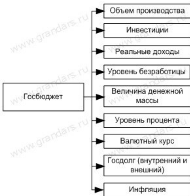
Рис. 27. Воздействие государственного бюджета на основные экономические показатели (слайд 4):