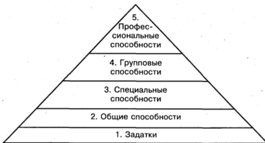
Рис. 4. "Конус способностей"

На рис. 4 наглядно представлена динамика и трансформация способностей.