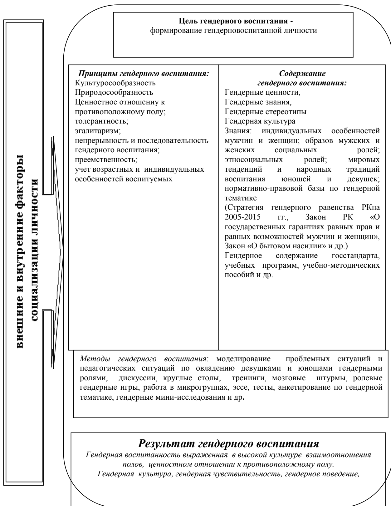
Рисунок 1- Модель реализации гендерного воспитания студенческой молодежи